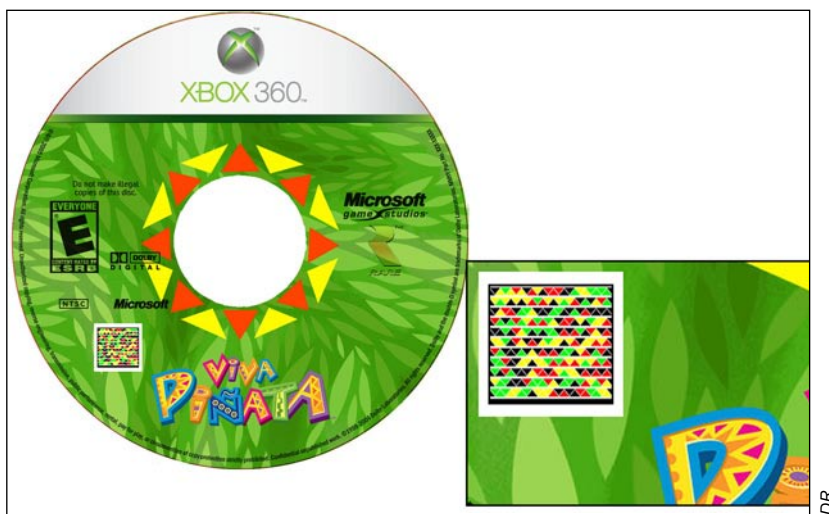
Le nouveau code identifiant HCCB permettra une meilleure traçabilité des DVD.

Ce système de codage offre l'avantage d'intégrer beaucoup plus d'information – jusqu'à 64 caractères – que le traditionnel code-barres noir et blanc, ce qui va permettre le développement de nouveaux services. Les éditeurs pourront ainsi mieux identifier et tracer les usages et les ayants droit, ce qui facilitera le paiement des royalties. Les consommateurs y trouveront aussi leur compte : les lecteurs de DVD ou les services de VOD (vidéo à la demande) pourront, par exemple,